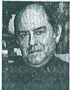
José Antonio Marina Catedrático de Filosofía y ensayista