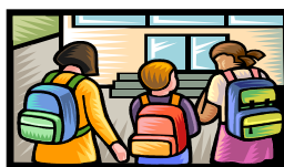
Figura clave del proyecto para la implantación de

un tercio del horario lectivo será en inglés. Con excepción de las asignaturas de lengua española y matemáticas, cualquier asignatura podrá impartirse en inglés. Cada centro tendrá autonomía para elegir las asignaturas que cursen en ese idioma. El programa también establece que cada colegio bilingüe cuente con una escuela "gemela" en el Reino Unido para facilitar los intercambios escolares.